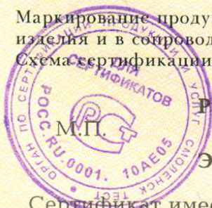
Схема сертификации-3, инспекционный контроль - один раз в год.

Маркирование продукции Знаком соответствия производится по ГОСТ Р 50460-92 на шильдике изделия и в сопроводительной технической документации.